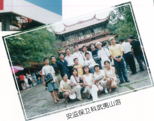
安监保卫科武夷山游