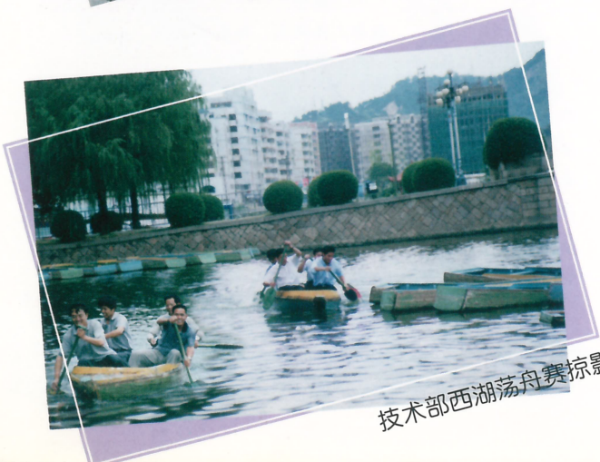
技术部西湖荡舟赛掠影