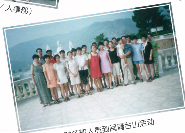
财务部人员到闽清台山活动