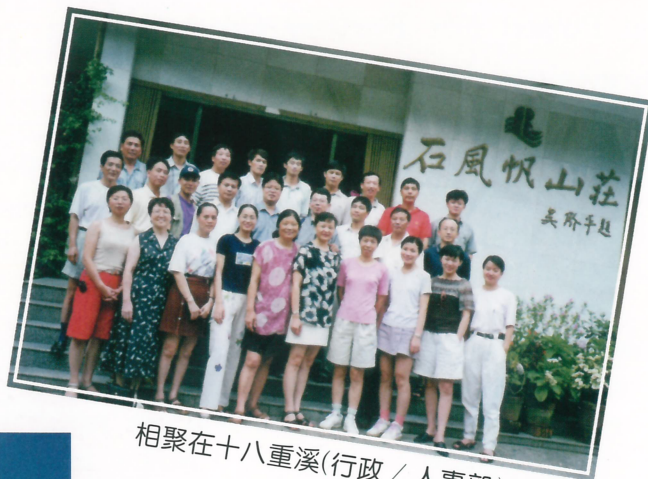
相聚在十八重溪(行政/人事部)